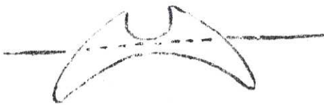
"nä", sedd inifrån båten, från Sollerön, Dalarna.