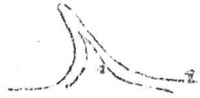
"nä" från Gokstadskjepen (från 700-talet)