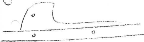
"nä", sedd utifrån båten, från Gästrikland