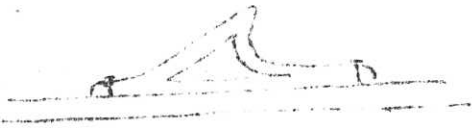
"nä" från Nydamskeppet (senare, 400 e.Kr.)