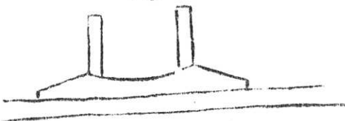
Årtullar från en västkusts- båt.